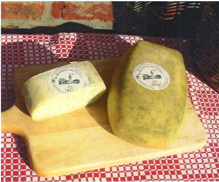
Keiemnaer 20+ met kruiden