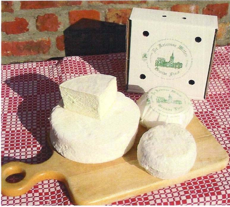
De Keiemse Witten