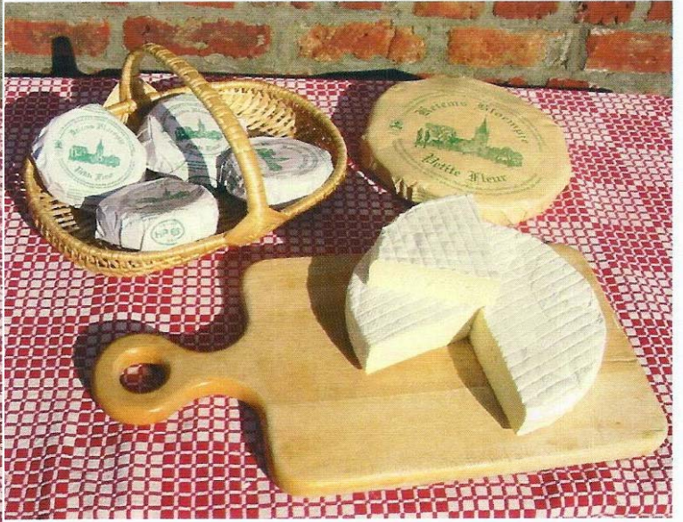
Het Keiems Bloempje (natuur)