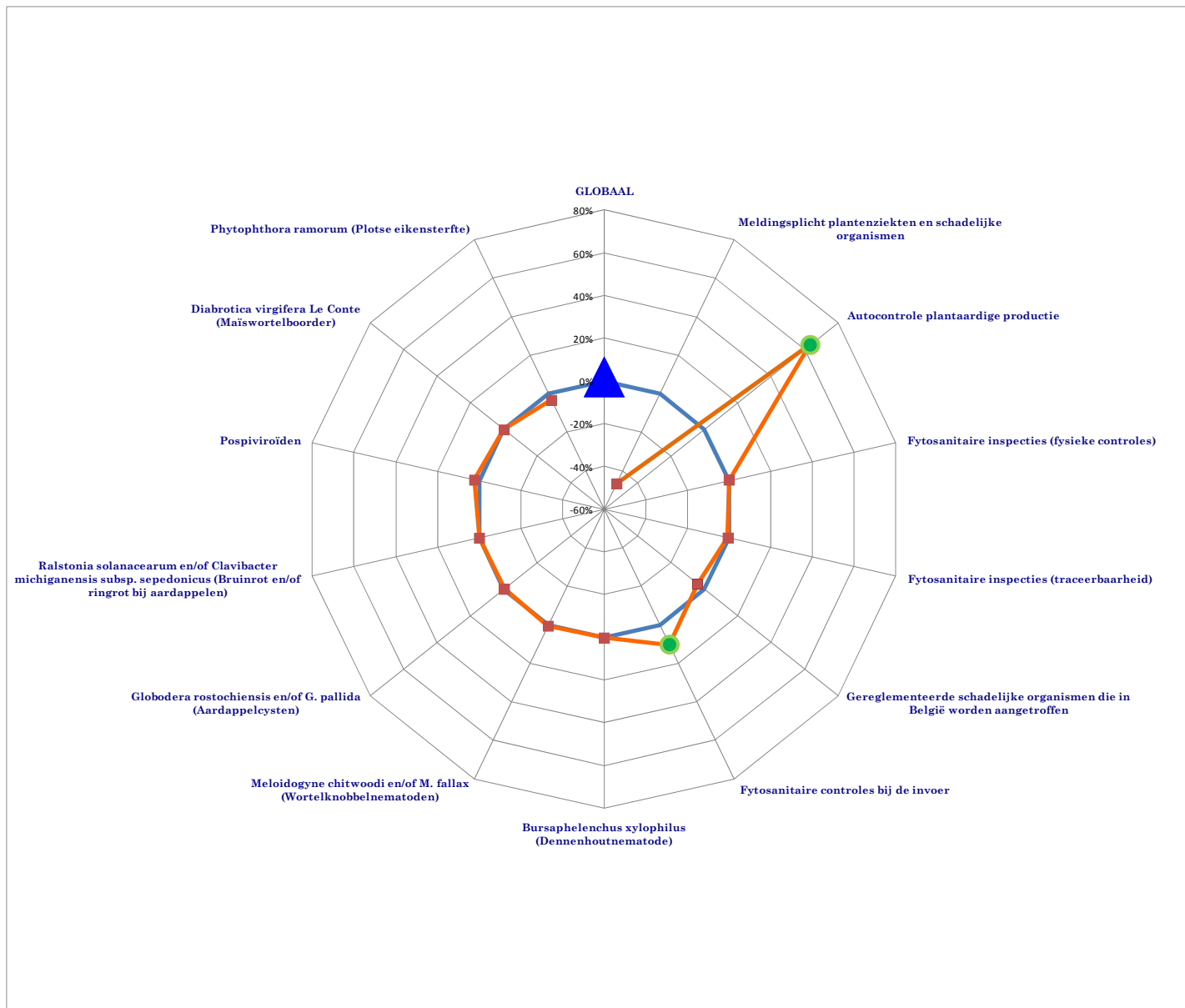
Figuur 3: Visuele voorstelling van de barometer plantengezondheid (fytsanitaire situatie): procentueel verschil tussen 2008 en 2009. ▲: globale plantengezondheid; ●: significante verbetering van de plantengezondheidsindicator; ●: significante achteruitgang van de plantengezondheidsindicator; blauwe lijn: status-quo.