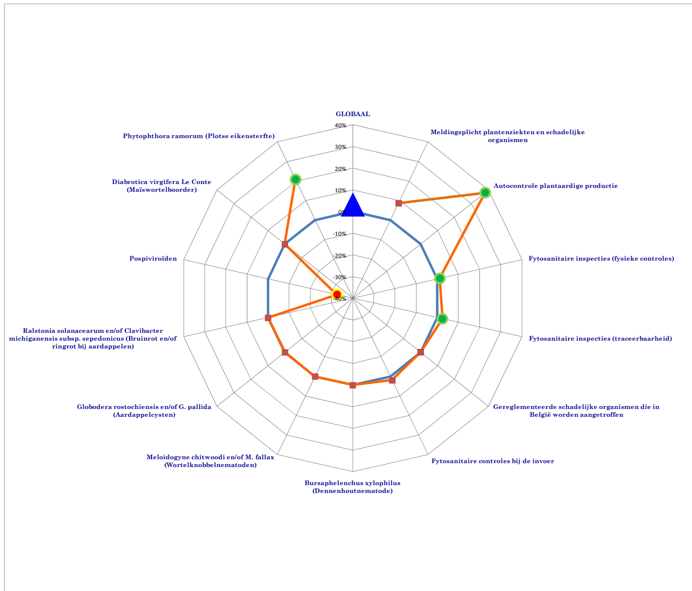
Figuur 4: Visuele voorstelling van de barometer plantengezondheid (fyto-sanitaire situatie): procentueel verschil tussen 2009 en 2010. ▲: globale plantengezondheid; ●: significante verbetering van de plantengezondheidsindicator; ■: significante achteruitgang van de plantengezondheidsindicator; blauwe lijn: status-quo.