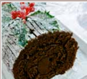
kerststronk als dessert? (pg 8)