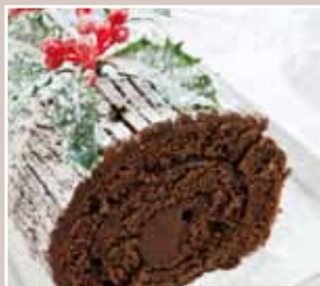
la bûche de Noël (p. 6)